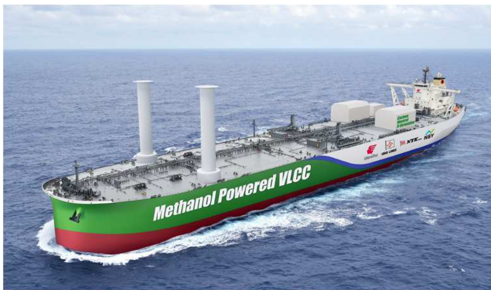
環境対応 VLCC・デザインコンセプトイメージ

日本のエネルギー輸送の担い手である 4 社は、国際海運の目標である 2050 年カーボンニュートラル実現に向けて、デザインコンセプトを元に更なる詳細検討を行い、次世代型環境対応 VLCC となる本船型の計画的、段階的な建造発注および国内向け原油輸送への早期導入を目指していきます。